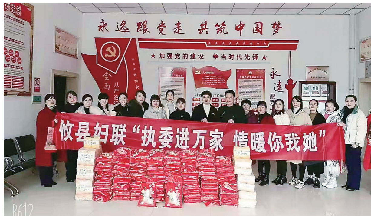
▲攸县妇联开展“执委进万家”活动为困难群众送温暖。

2021年2月,我市全面完成村(社区)妇联换届工作;3月,市妇联在全市启动“妇联执委大走访”,要求2.7万名基层妇联执委面对面联系妇女群众,亮明身份,发一张联系卡,绘一张民情图,解决一个实际问题,为有需要的妇女儿童及家庭成员送去温暖。此举,成为我市党史学习教育“我为群众办实事”生动实践。近日,记者深入基层,了解走访情况和群众评价,见证妇联执委的付出和收获。