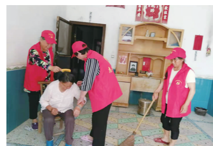
▲攸县妇联通过“3+1”姐妹帮帮团常态化走访结对群众和家庭,为她们打扫卫生、梳头,解决实际困难。