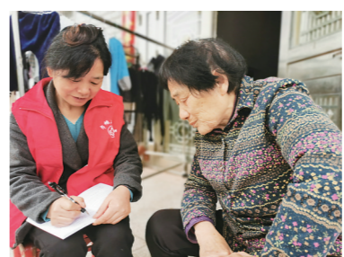
▲石峰区妇联执委走进居民家庭了解群众需求。