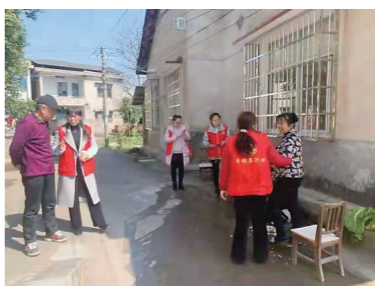
▲涠口区涠口村妇联执委走街入户,了解群众需求,宣传湘妹子能量家园试点工作。