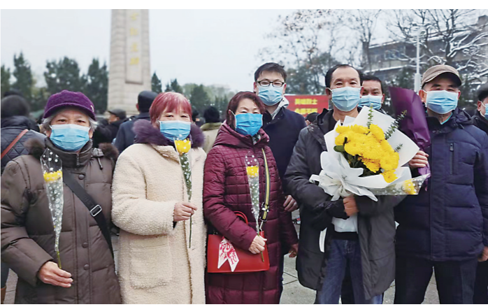
▲苏本桥烈士后代手捧鲜花祭奠先人。记者/何春林 摄

仪式,缅怀英烈,就是要以英烈为榜样,学习他们忧国忧民、上下求索的革命情怀,学习他们无私奉献、舍生取义的高尚品质,做到胸怀理想、追求真理,敢于担当、无私奉献,让我们以实际行动向英烈致敬。