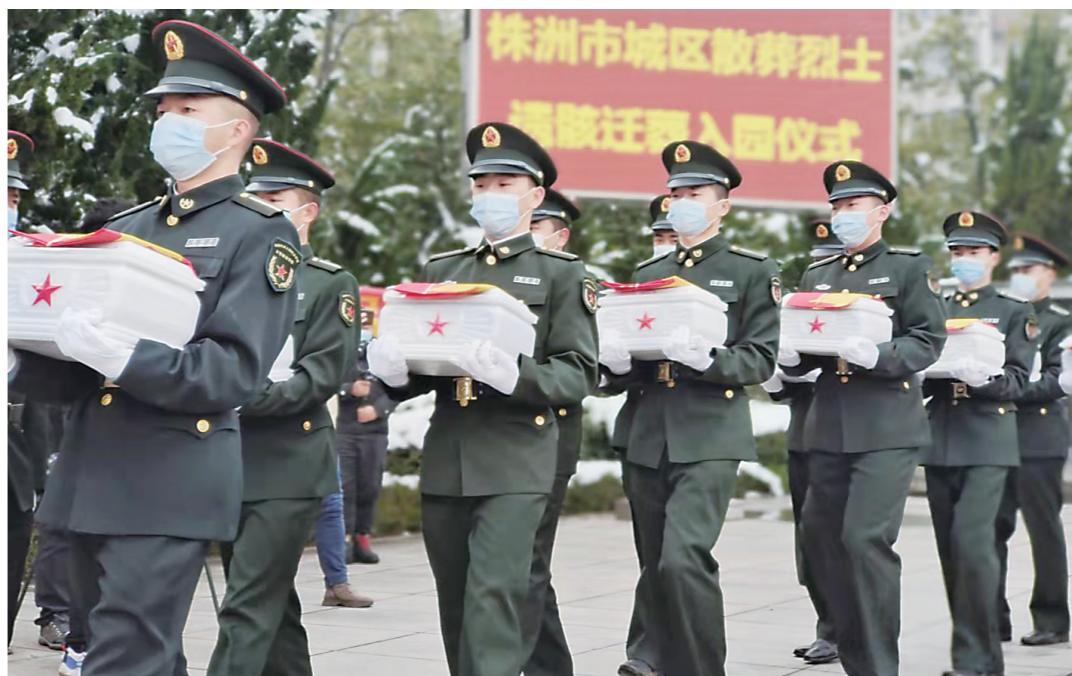
▲昨天上午,株洲城区27名散葬烈士遗骸迁葬入园。

本报讯(株洲晚报融媒体记者/何春林 邱鹏)12月28日11时18分,雪后的株洲烈士纪念馆格外清朗肃穆。株洲城区散葬烈士遗骸迁葬入园仪式在此举行,迎接城区首批27位散葬烈士遗骸“回家”。