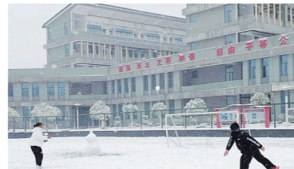
▲株洲师专恢复办学后,同学们迎来第一场大雪。