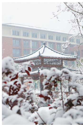
▲南方中学新校区的三省亭。