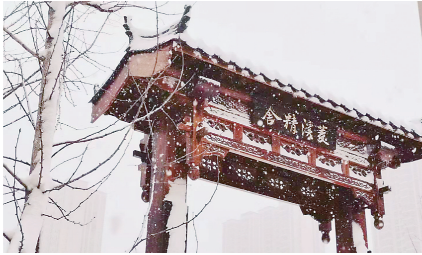
▲菱溪中学古香古色的门额。

一场如期而至的大雪,让大地银装素裹,校园也披上了白纱外衣。许久未见过的雪,让师生们感叹,我们的校园也有了新模样。