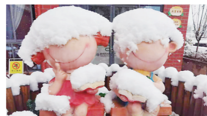
▲凿石小学图书馆边可爱的人偶。