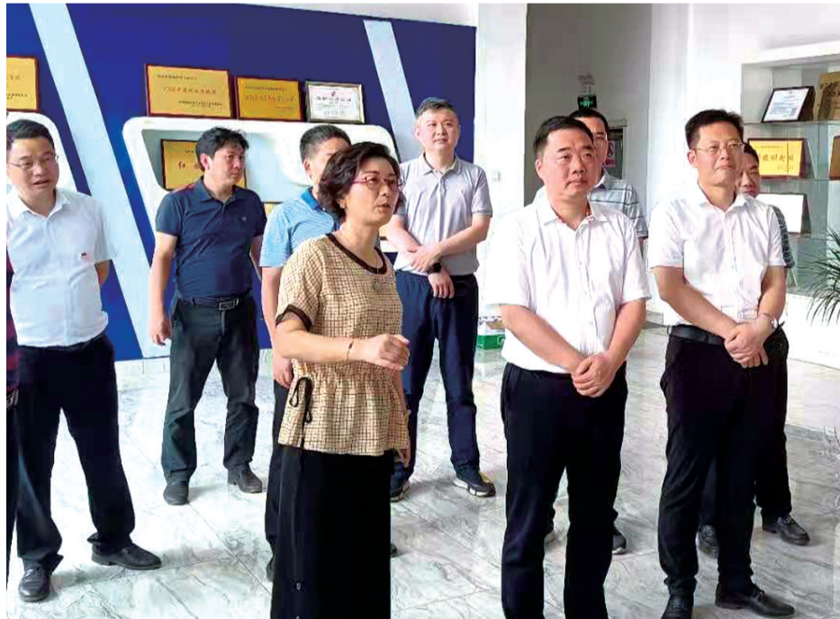
▲攸县县委书记李鹏程调研园区改革和高分子产业链发展。

目前,在全市率先实施药品经营“多证合一”改革工作,并颁发全市首张“多证合一”药品经营许可证;在全市1至6月的“三比三看”大竞赛活动中,“比营商环境,看满意度”中排名前五县市第一。