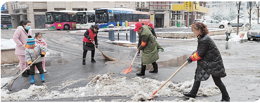
天元区栗雨街道各社区干部齐上阵,清扫积雪暖人心。