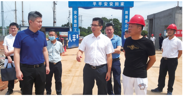
▲攸县县委副书记、县长武柳强调研园区企业。

持续强力推进课时津贴改革,严格落实“双减”政策,新高考首战首捷,本科以上万人上线率居全市第一,连续六年获评株洲市“高中教育质量建设先进县”。