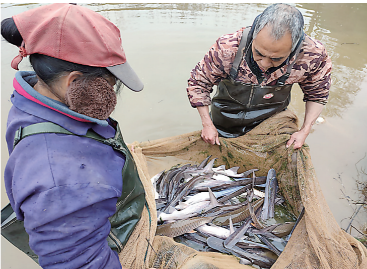
村民在鱼塘捕鱼。

通过这场资源变资产、资金变股金、农民变股东的“三变”改革,官溪这个资源匮乏村迎来了新生。