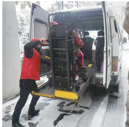
▲老人出行不方便,无障碍专车上门接送。

行、上下楼等。有需求的市民可拨打该中心电话(0731)22286180进行预约。