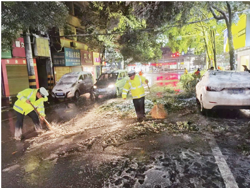
▲交警通宵达旦执勤除雪。

当天,共启动执法服务站8个,设立临时执勤点11个,设置低温雨雪减速慢行提示牌56块,出动警力800余人次,警车200余台次。城区共接处警416起,排名前三的分别是交通事故、设施故障、秩序维护警情。全市未发生亡人事故,未发生大面积长时间拥堵。