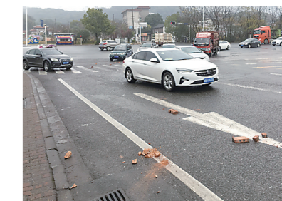
▲掉落在行车道上的砖块。

本报讯(株洲晚报融媒体记者/刘平)12月25日上午,石峰大桥、响田西路及铜霞路,多处路面掉落有砖块,很多砖块被过往车辆碾压,所幸未引发交通事故。