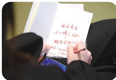
▲在贺卡上写下自己微信,方便联系。