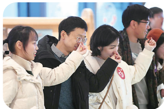
▲“抓鸭子”游戏输的嘉宾接受惩罚。