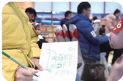
▲每位嘉宾画出自己对未来生活的憧憬。