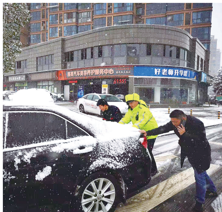
交警及时处置事故，帮助群众脱困。

株洲交警温馨提醒广大驾驶员，雪天行车一定降低车速，注意观察路面情况。若发现前方路面在灯光照射下有颗粒状反光时，应该特别警惕，路面可能存在结冰现象。桥梁、隧道口是易结冰点段，请注意观察道路右侧道路提示牌，提前减速。行驶结冰路段时，请减速与前车保持安全车距，沿着前车的车辙印记缓慢行驶，切勿猛踩油门、刹车和猛打方向，谨防车辆出现侧滑现象。