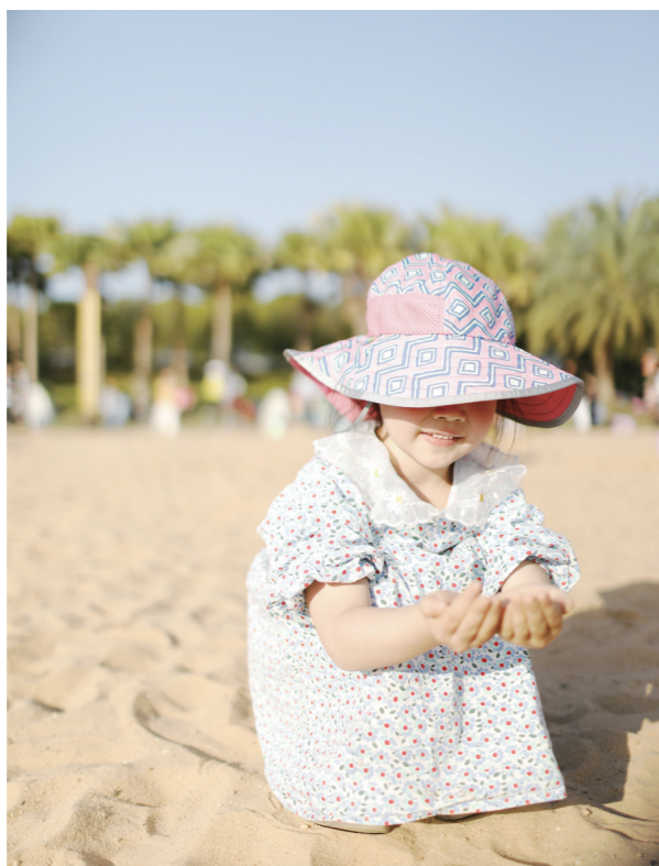
▲在万丰湖畔,家长和孩子晒太阳、玩沙子。

当然,家长也可以选择往北走,到石峰公园爬山、逛逛动物园。山虽不高,但错落有致,山上还建有许多娱乐设施以及烧烤专区,非常适合带着家人、朋友出游。