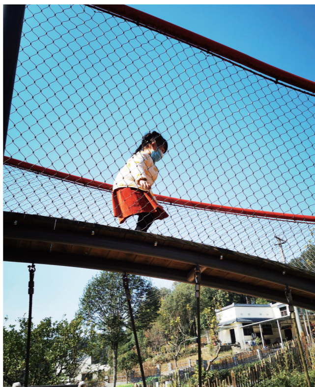
▲户外游乐设施也是孩子们的“欢乐天堂”。