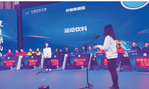
▲比赛紧张激烈,选手表现精彩。

本报讯(株洲晚报融媒体记者/温琳 通讯员/周潭清)“运动后补水的正确方式是什么”“东京奥运会中国代表团获得多少枚金牌”“2022北京冬奥会何时开幕”……2021株洲市首届全民健身知识大赛总决赛昨日落下帷幕,市排舞协会获得冠军。该赛事由市文旅广体局主办,12月1日正式启动,大赛围绕全民健身知识、锻炼方式、奥运知识、体育常识等相关内容出题,赛制新颖,趣味性强,得到广大市民积极参与,并在株洲掀起了新一轮全民健身热潮。