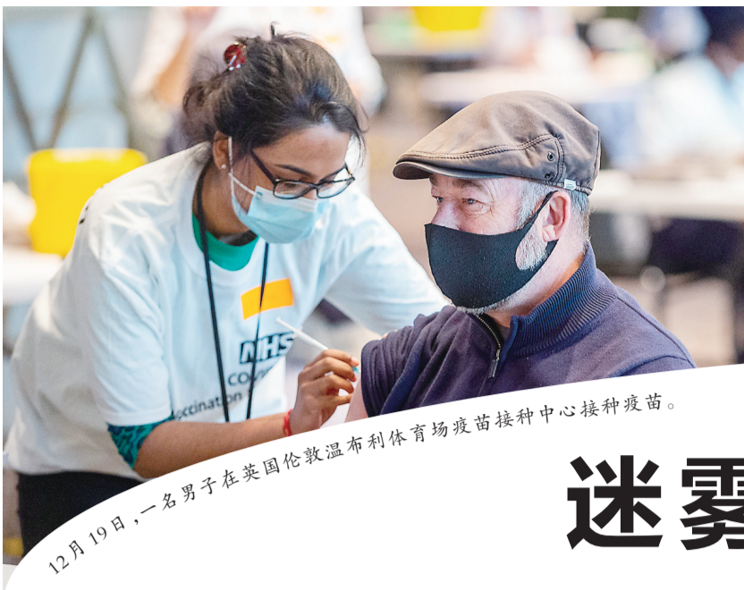
12月19日,一名男子在英国伦敦温布利体育场疫苗接种中心接种疫苗。