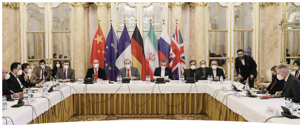
12月17日在奥地利维也纳拍摄的伊朗核问题全面协议联合委员会政治总司长级会议现场。