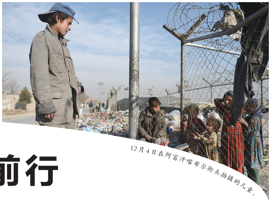
12月4日在阿富汗喀布尔街头拍摄的儿童。