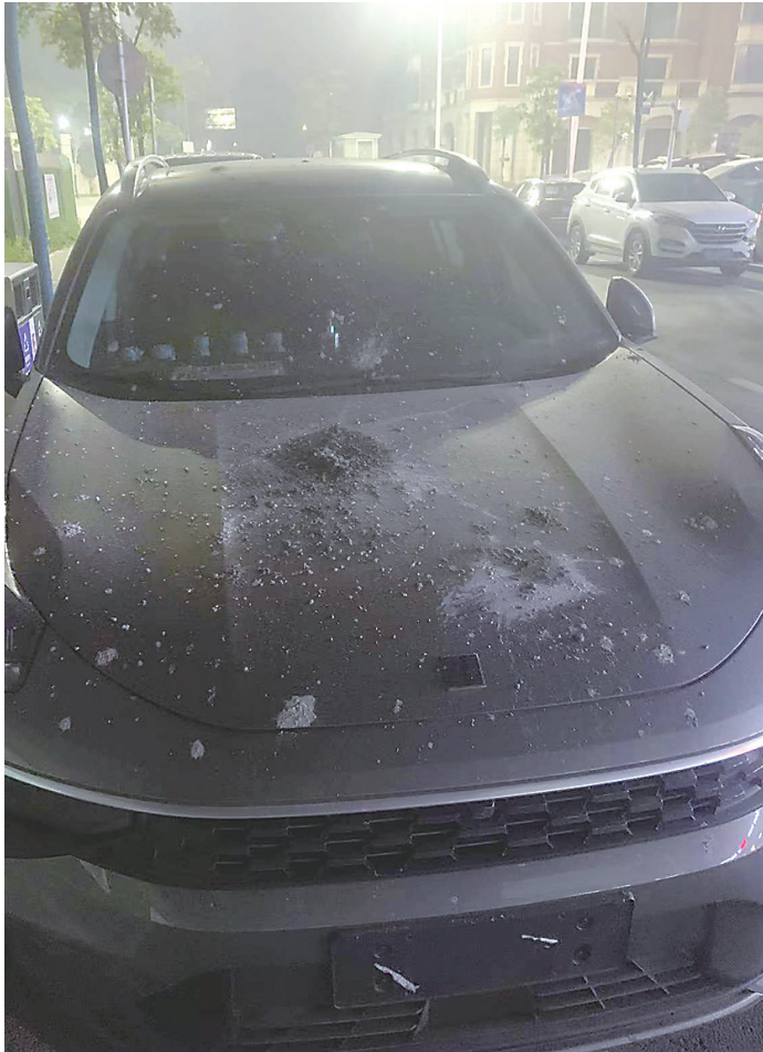
万先生被砸车辆引擎盖上的水泥印迹。