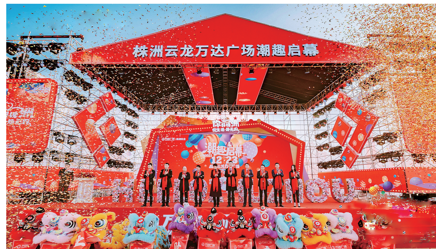
▲株洲云龙万达广场开业现场。