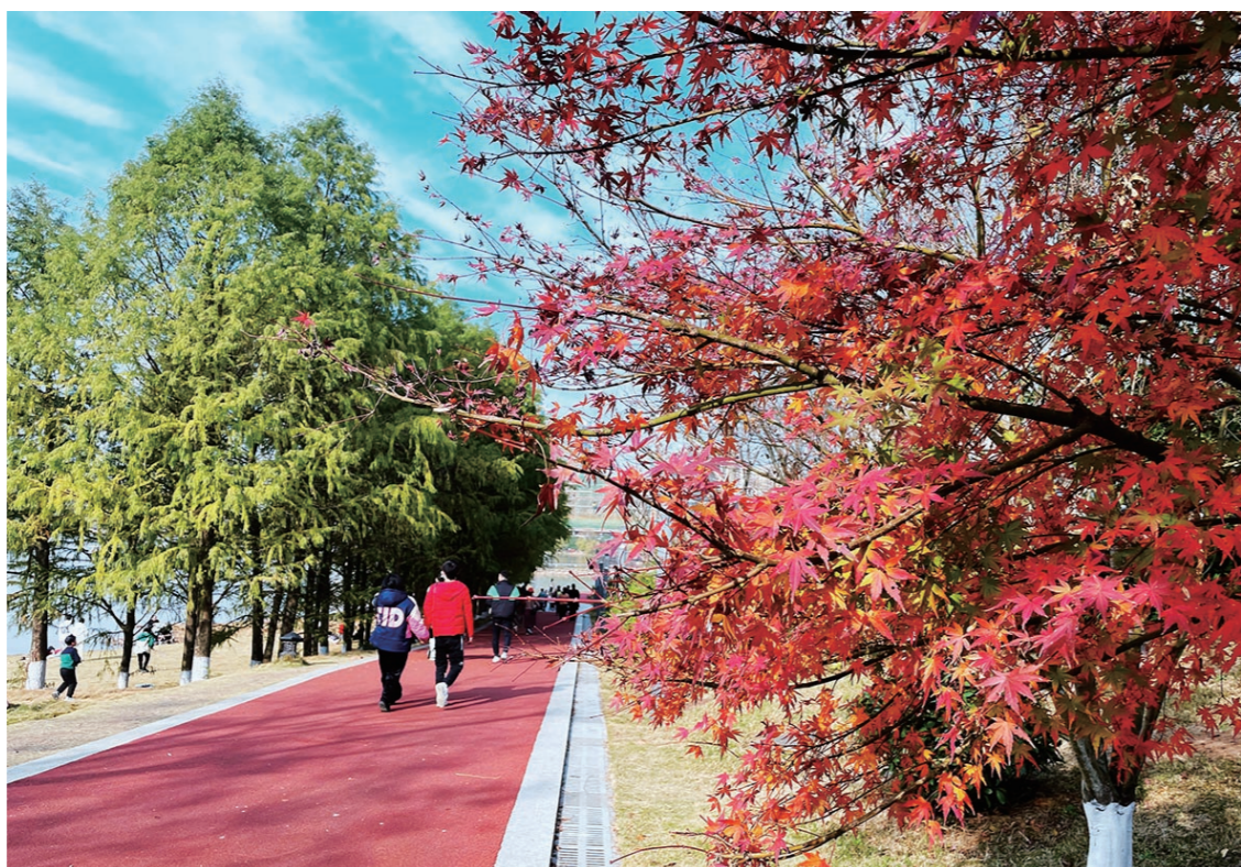
▲12月23日,市民抓紧享受降温前的温暖阳光。