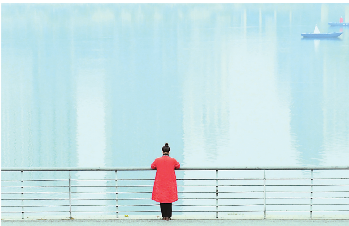
近日,河西湘江边,一位市民凭栏而立,安静地欣赏着江面美景。