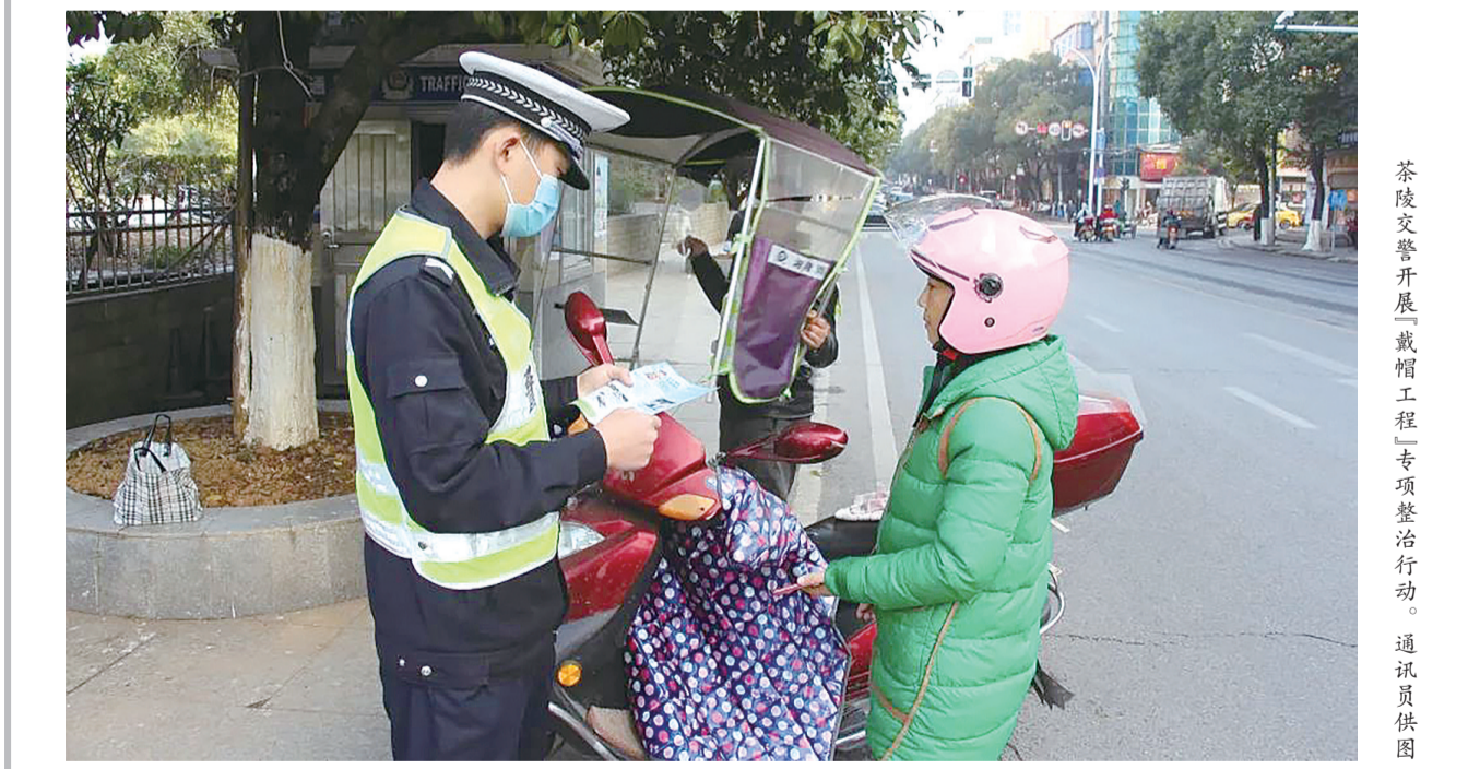
茶陵交警开展“戴帽工程”专项整治行动。