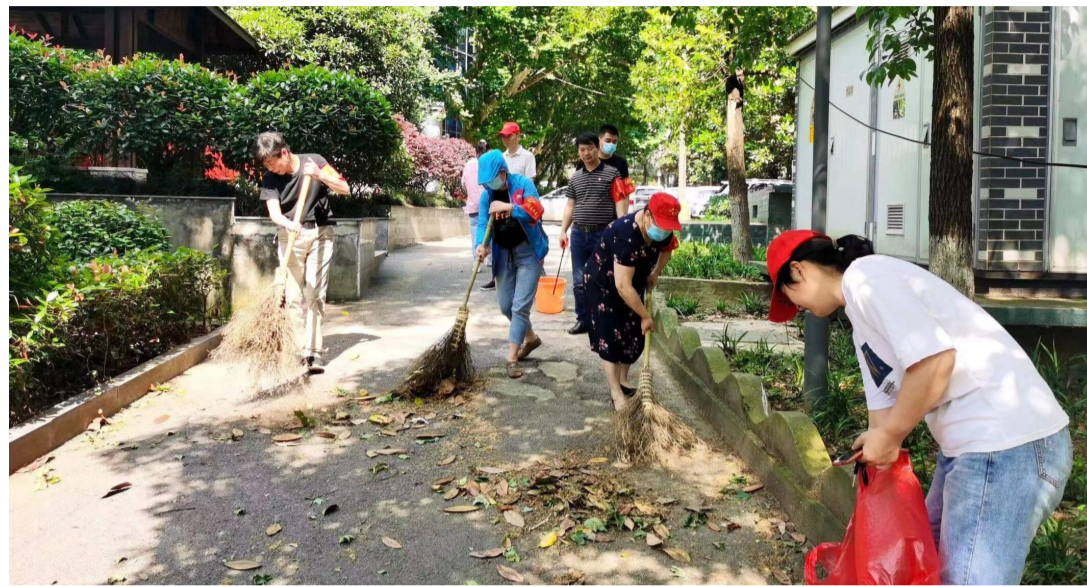
株洲日报·掌上株洲记者/周高 通讯员/谭洪汀

“将党组织延伸到楼栋,让每个党员发挥作用,让老旧小区实现了‘逆生长’。”12月15日,石峰区选矿小区内,提起去年12月小区党支部正式成立后所做的事实,居民们赞不绝口。通过多次牵头组织“居民议事会”,将居民反映的问题归纳整合,并组织小组长、楼栋长挨家挨户了解居民诉求,把问题进行分解逐个解决,今年,小区环境明显改善,居民物业费缴纳率达90%以上。 这是石峰区以基层党建服务居民的缩影。作为工业老区,该区破产改制企业较多,小区直管党员中60岁以上党员占比近70%,给社区和小区党组织教育管理带来系列难题,影响了党员作用的发挥。 为精准破题,该区认真贯彻落实全市“动力党建 活力家园”相关要求,大力弘扬“火车头精神”,以“三会一课”为载体,结合社区网格化管理优势,聚焦居民群众需求,创新推行“三个一”工作法,充分发挥党员“探头”作用,聚力解决群众急难愁盼问题,居民群众满意度持续攀升。