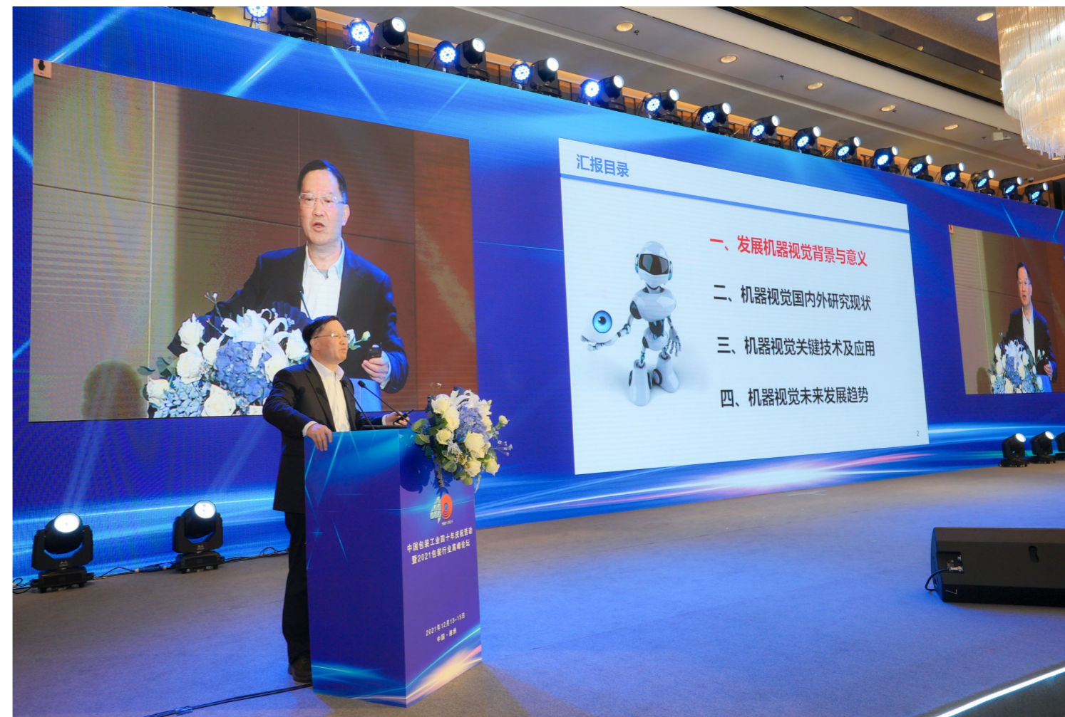
▲昨日,中国包装工业四十年庆祝暨2021年包装行业高峰论坛在株举行,众多包装行业大咖齐聚“论剑”。图为中国工程院院士王耀南以“智能自主作业机器人关键技术及发展趋势”为主题进行了演讲。