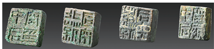
▲江村大墓外藏坑出土的印章(2020年5月7日摄)。