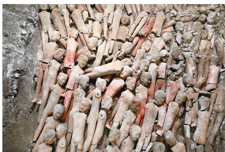
▲江村大墓外藏坑出土的着衣陶俑(10月8日摄)。

2011年至2013年,汉陵考古队采用考古勘探、地质探测等多种技术手段反复对凤凰嘴进行了大范围细致探查,除了10多件明清碑石以外,考古人员在凤凰嘴没有发现任何汉代陵墓遗迹。由此,考古人员证实霸陵位