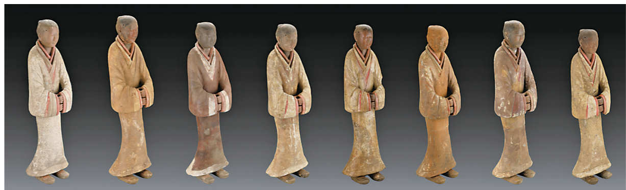
▲薄太后南陵外藏坑出土的一组陶俑(2020年5月7日摄)。

14日,“汉文帝霸陵被发现”的消息登上热搜,据媒体报道,目前基本确认江村大墓为西汉早期汉文帝刘恒的霸陵,引来不少网友感叹“涨知识了”。值得注意的是,也有报道提到,人们传统认识中汉文帝霸陵是在一个叫凤凰嘴的地方,此次江村大墓确认为真正的汉文帝霸陵,纠正了一个流传近千年的关于西汉帝陵的错误认识。