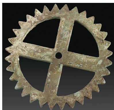
▲江村大墓外藏坑出土的铜齿轮(2020年5月7日摄)。

置在凤凰嘴的记载出现了谬误,开始对凤凰嘴2公里外的江村大墓进行调查发掘。江村大墓是一座有四条墓道的特大“亚”字形竖穴土坑木椁墓,地面没有封土。这与《史记·孝文帝本纪》中“治霸陵皆以瓦器……不治坟”的记载十分吻合。“亚”字形在汉代当时是顶级配置,是只有皇帝、皇后才能用的墓葬形制。