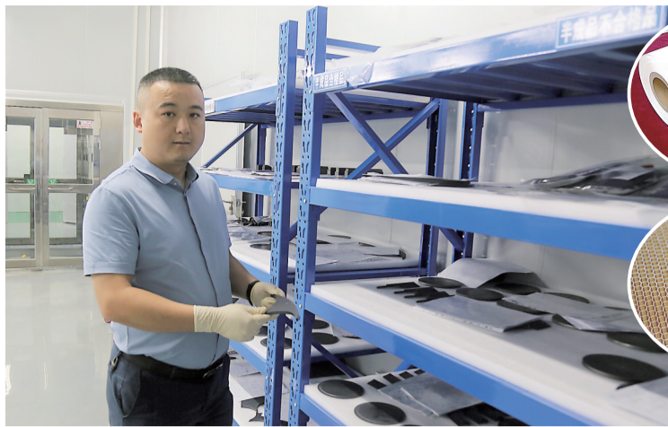
德智新材研发的产品,实现国产SiC涂层石墨基盘“零”的突破