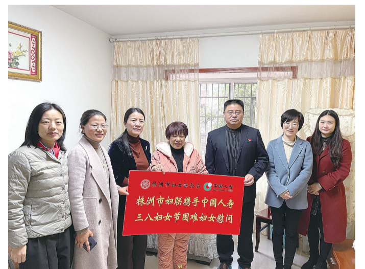
市妇联、中国人寿株洲分公司开展联合慰问。