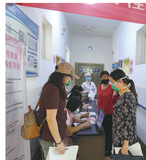
荷塘区仙庾镇开展“两癌”检查。