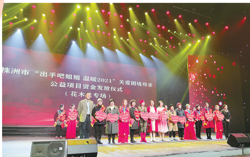
株洲市“出手吧姐姐 温暖2021”关爱困境母亲公益项目资金发放仪式(花木兰专场)

近日,从省妇联传来好消息,株洲今年从全国低收入妇女“两癌”救助专项基金获得178万元救助资金,这意味着我市将有178名“两癌”困难妇女分别可获得1万元救助。“两癌”检查实施六年来,我市共为全市51.2万名妇女提供免费检查,市妇联争取到全国、省级帮扶资金1211万元,自筹帮扶资金230余万元,直接帮扶贫困“两癌”妇女3800余人。