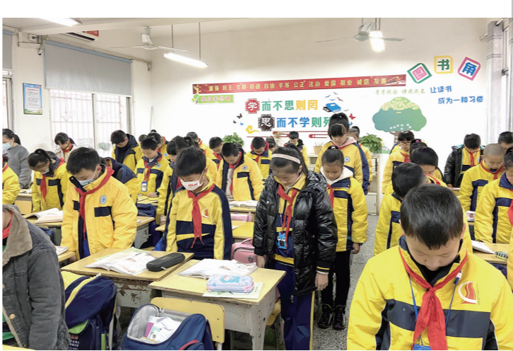
栗树山小学在各班教室举行主题班会,为死难同胞默哀。

铭记祖国历史的创伤,珍惜今天来之不易的幸福生活。这是该校《国旗下的红领巾》系列课程之一。