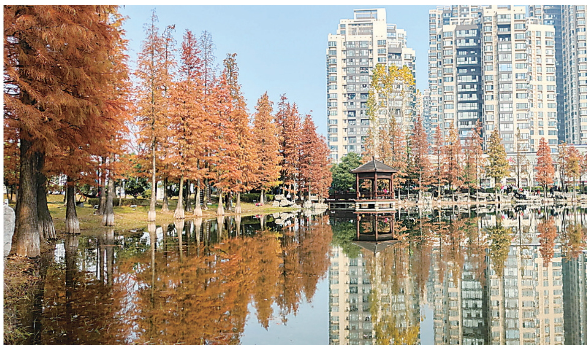
近日,暖阳。褐红色的水杉与林立的高楼映衬在栗雨湖面,宛如一幅水彩画。

昨日,中央电视台第五套和第十三套《冬奥来了》节目中,株洲市二中附小轮滑队惊艳亮相4分钟,镜头记录了该校开展轮滑运动的点点滴滴。昨日,该校学生钟雨泽代表株洲参加全省比赛,荣获第五名。近期,该校轮滑队将前往吉林长春,参加北京冬奥会的暖场比赛。图为市二中附小的孩子们正在进行轮滑训练。