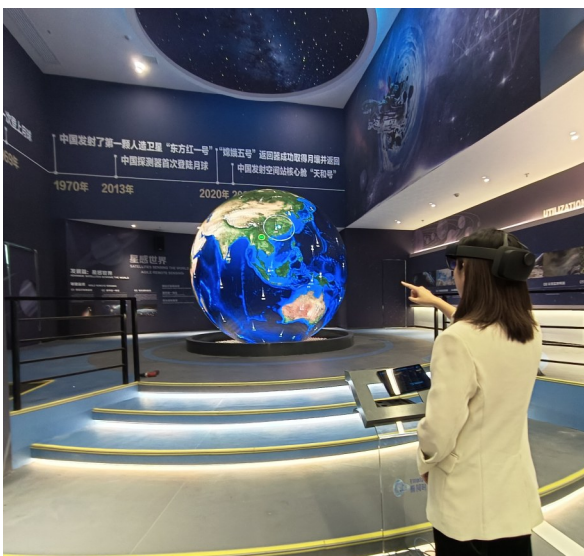
参观者用手势识别,体验模拟太空遥感任务。

“椭圆时空”作为全球广域综合感知服务的开拓者,由原国家重大航天工程专家联合中科院、清华大学专家共同创立,面向国际前沿的太空先进技术、空地海一体化应用技术两大方向开展探索和产品研发。“星池计划”是“椭圆时空”正在建设的全球首个通导遥一体化卫星星座,计划向太空发射100余颗小卫星,形成即时遥感、万物互联和导航增强综合服务能力,将成为全球数字经济发展的坚强支撑。星座将在北斗导航系统基础上,为用户提供亚分米级导航增强服务,与北斗系统共同为智慧城市、智慧交通、智慧环保、智慧农业等领域进行赋能。