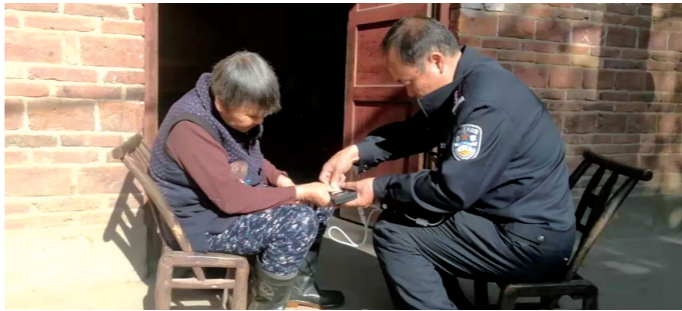
▲枫溪派出所组织辅警为老人采集指纹。

随着工作深入开展,枫溪派出所社区民警得知辖区内有老人因年事高、身体弱、行动不便等原因而不便到派出所进行二代身份证指纹采集,便通过“辖区网格群”进行广泛宣传,提前通知,随后逐一上门服务,让群众少跑腿,得到群众连连称赞。“我父亲常年行动不便,我们又不回家,多亏民警同志上门采集指纹,让我们也放心多了。”采集完毕后,一老人家属对民警连声感谢。