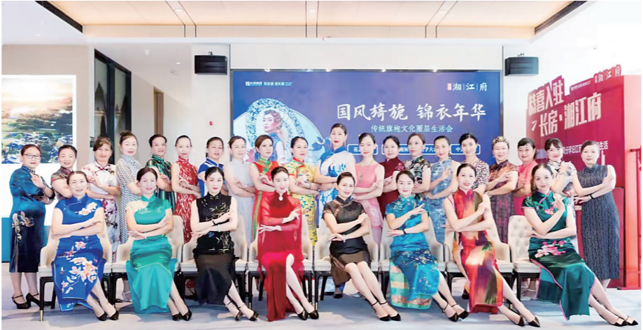
▲市旗袍文化研究会成员展示旗袍之美。