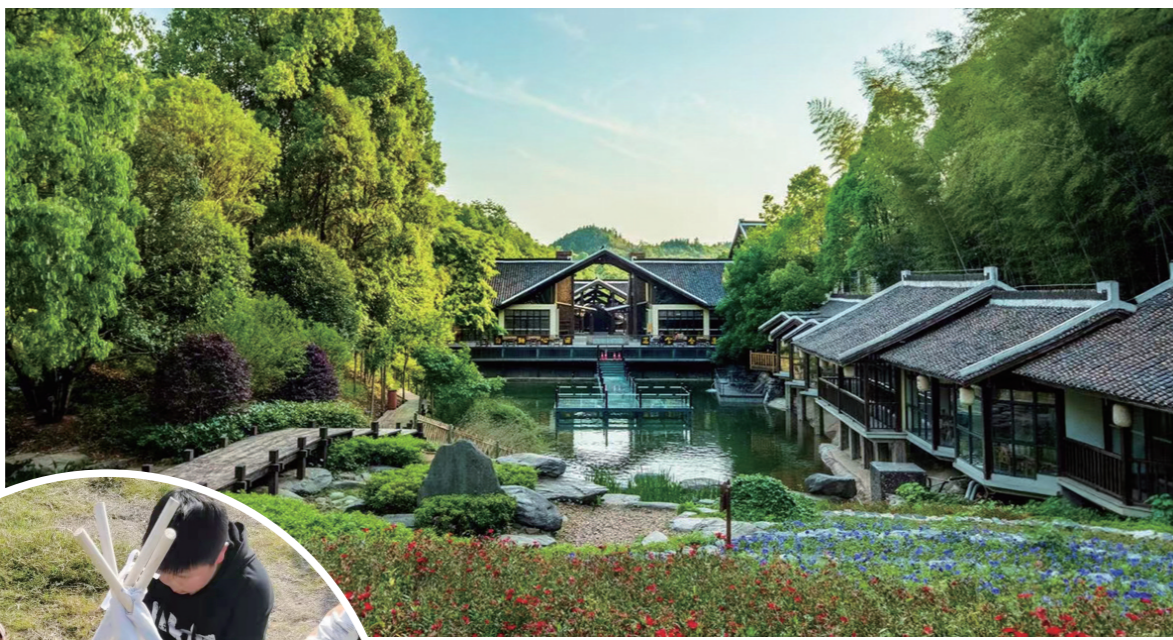
▲隐藏在竹林间的独栋民宿。

在消费者旅行距离不断缩短,乡村振兴号角不断吹响的当下,旅游公司开始将目光转向广大乡村。通过整体开发运营、代运营等方式,从昔日带客下乡到建设乡村旅游目的地。这一方式,能否开辟一片新蓝海?