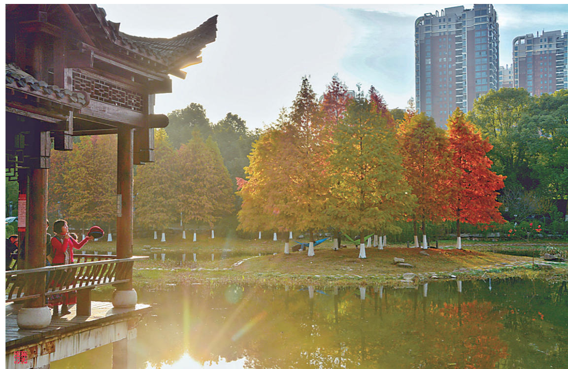
▲天鹅湖公园里的水杉树红了,鲜艳夺目。网友“神龙宝刀” 摄