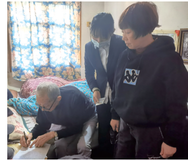
▲工行工作人员为老人上门服务办理社保卡

2021年11月以来,社保卡新开、核查、激活、账户变更等业务与日俱增,工行奔龙支行秉承以客户为中心的理念,想客户之所想,急客户之所急,将便民金融融入生活,积极投入社保卡服务工作,为周边有上门需求办理业务人员提供便捷服务。“老人家八十多岁了身体不佳,