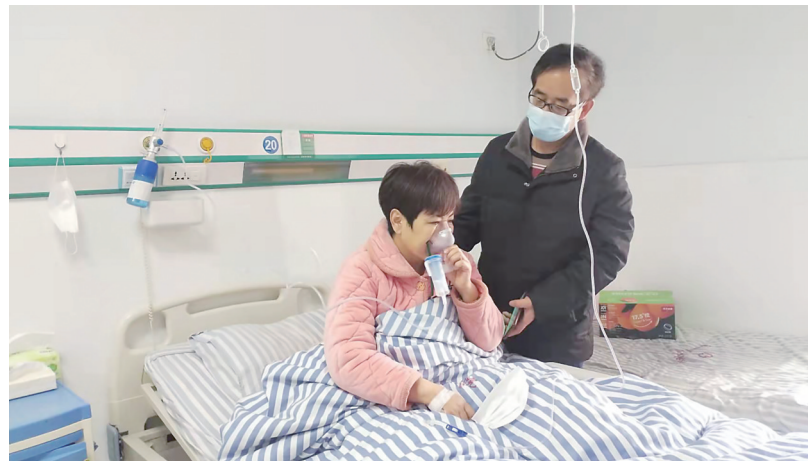
▲马女士接受术后康复治疗。

“我在株洲人生地不熟,担心医生不尽心。”于是,马女士让爱人给主治医生偷偷塞了个1000元的红包,见医生没有将红包当即退还,夫妻俩这才放下心来。