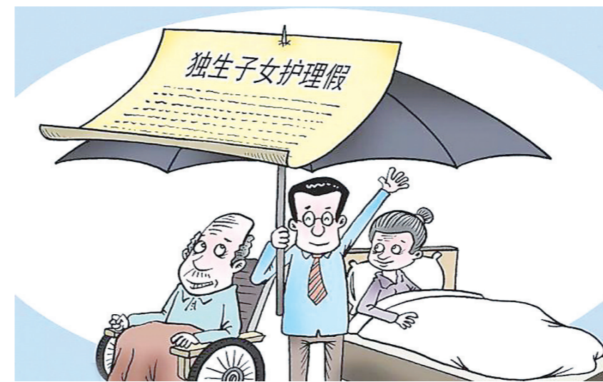
“独生子女父母护理假”正式在我省落地。

条例的出台无疑从法规上给了独生子女尽孝一个保障。但也有网友表示担心:政策是好的,但企业会愿意执行吗,政策能落实到位吗?