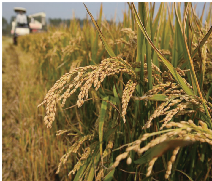
驾驶员驾驶收割机在江苏省无锡市惠山区前洲街道友联村收割水稻(10月30日摄)。

新华社北京12月6日电 国家统计局6日发布数据,2021年全国粮食总产量达13657亿斤,比上年增长20%,全年粮食产量再创新高,连续7年保持在1.3万亿斤以上。