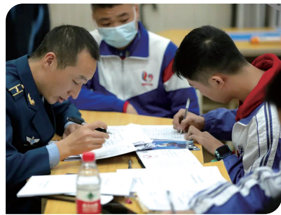
▲2021年下学期空军招飞荷塘区初选检测在该校举行