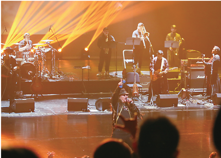
▲杭盖乐队在神农大剧院激情演唱,给株洲歌迷带来一场视听盛宴。