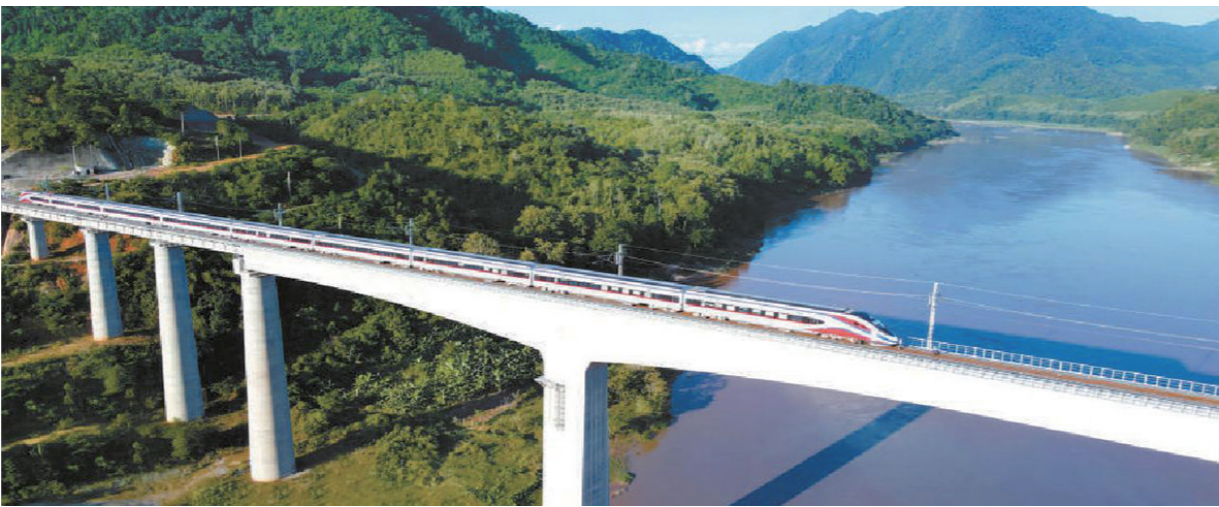
▲“澜沧号”动车组驶过琅勃拉邦跨澜公河特大桥。

中共中央总书记、国家主席习近平12月3日下午在北京同老挝人民革命党中央总书记、国家主席通伦通过视频连线共同出席中老铁路通车仪式。