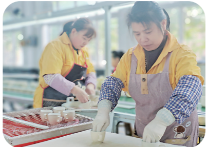
▲市人社局将“醴陵陶瓷工匠”特色劳务品牌牌匾送至醴陵。

产业的背后是人才在支撑。日前,市人社局将“醴陵陶瓷工匠”特色劳务品牌牌匾送至醴陵市。醴陵市正以“培育制造名城、建设幸福株洲”为牵引,聚焦陶瓷千亿产业集群,大力培养陶瓷工匠,推动陶瓷产业升级。