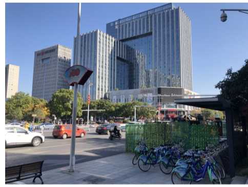
黄河路口,不少共享单车停放在施工围挡外。