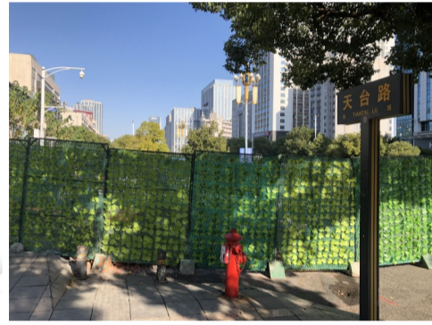
施工围挡短期内造成市民通行不便。