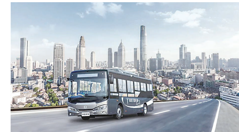
中车电动公司为杭州量身定制的C08效果图。

本报讯(株洲晚报融媒体记者/高晓燕)近日,中车时代电动汽车股份有限公司成功中标312台“杭州公交8米纯电动城市公交车项目”及“全生命周期维保服务项目”,将为杭州再添“风采”。