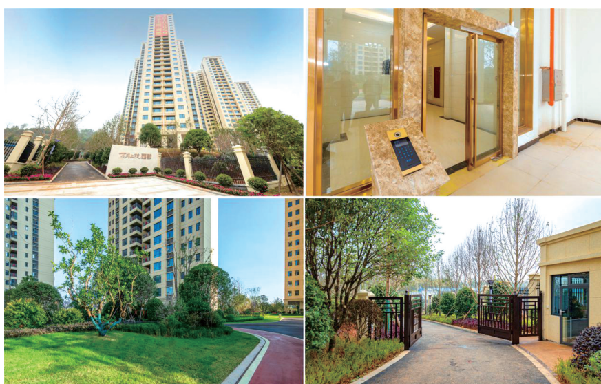
▲西郡一期实景现房