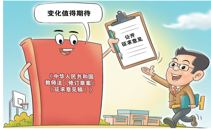
漫画:公开征求意见

教育部日前在其网站公布《中华人民共和国教师法(修订草案)(征求意见稿)》,面向社会公开征求意见。修订草案征求意见稿将“四有”要求纳入教师职责使命,进一步明确教师权利义务、提高教师准入门槛、突出师德师风评价标准,并在教师待遇和保障方面作出规定。