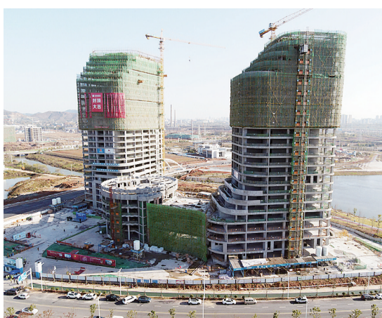
正在建设的清水塘环湖科创园一期产业服务中心。