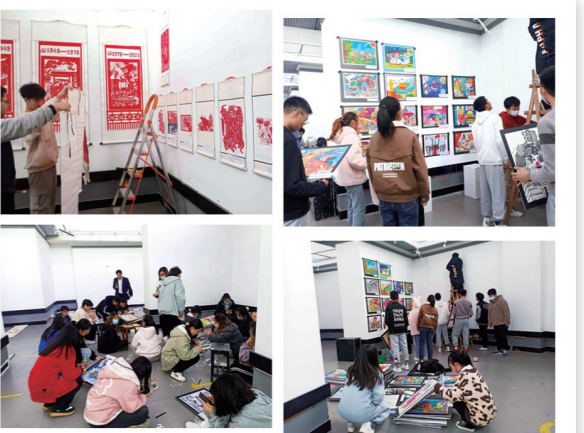
▲书画展前期布置 (图/文 刘静)