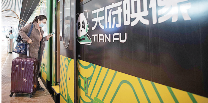
11月25日,乘客搭乘“天府映像”主题列车。当日,全国首列巴蜀文化主题涂装复兴号动车组“天府映像”在四川成都上线。该主题列车以CR200J型复兴号动车组为车体,融入大熊猫、盖碗茶、川剧折扇、蜀竹、太阳神鸟等文化元素,展示巴蜀地域的文化特色和人文底蕴。

新华社北京11月25日电 记者25日从全国妇联获悉,全国妇联权益部日前发布《家庭暴力受害人证据收集指引》,对“证明发生过家庭暴力事实的证据”及“证明面临家庭暴力现实危险的证据”等作了详细说明,用于帮助受害人树立证据意识,依法维护自己的合法权益。 由于家暴受害人缺少保存和收集证据的意识,很多情况下受害人不知道如何收集证据、哪些可以作为证据使用、收集的证据有什么用。鉴于此,指引提示,公安机关出警记录、告诫书、伤情鉴定意见、村(居)民委员会、妇联组织、反家暴社会组织、双方用人单位等机构的求助访问记录、调解记录,受害人病历资料、诊疗花费票据,实施家庭暴力的录音、录像,身体伤痕和打砸现场照片、录像,加害人保证书、承诺书、悔过书,证人证言、未成年子女证言以及受害人的陈述等,均可作为证明发生过家庭暴力事实的证据,受害人注意保存或向有关部门申请查阅调取。 指引提醒受害人,如果加害人通过电话、短信、微信、QQ聊天记录、电子邮件等威胁、恐吓的,受害人可以录音、截屏等方式保存此类证据,具备条件的,可以通过公证处提取电子证据。