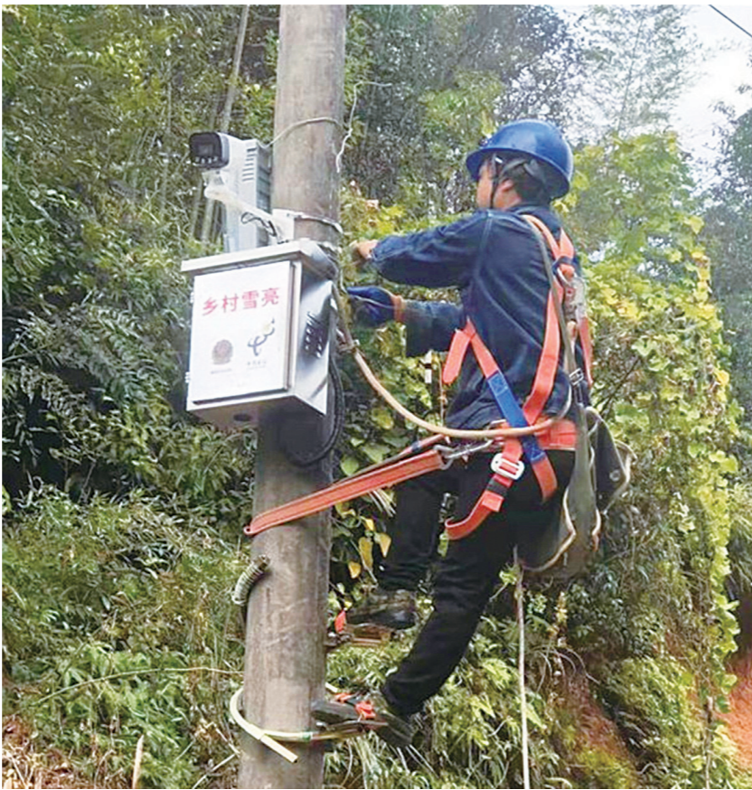
▲工作人员正在对一处视频监控装置进行电路调试。

“天眼”设备装一处,电力线路便引入一处。醴陵市“雪亮工程”涉及17个乡镇、4个街道办事处,1000多个点位,国网醴陵供电公司积极响应号召,投身于“雪亮工程”装表接电工作。在装表接电前,工作人员先与当地民警对接接入点——确定,现场勘察供电方案,就接电过程的各个细节与公安机关协商,确保以最优的接电方式,高质量落实“雪亮工程”。目前,该公司正抓紧时间组织协调安装,确保按时按质完成任务。