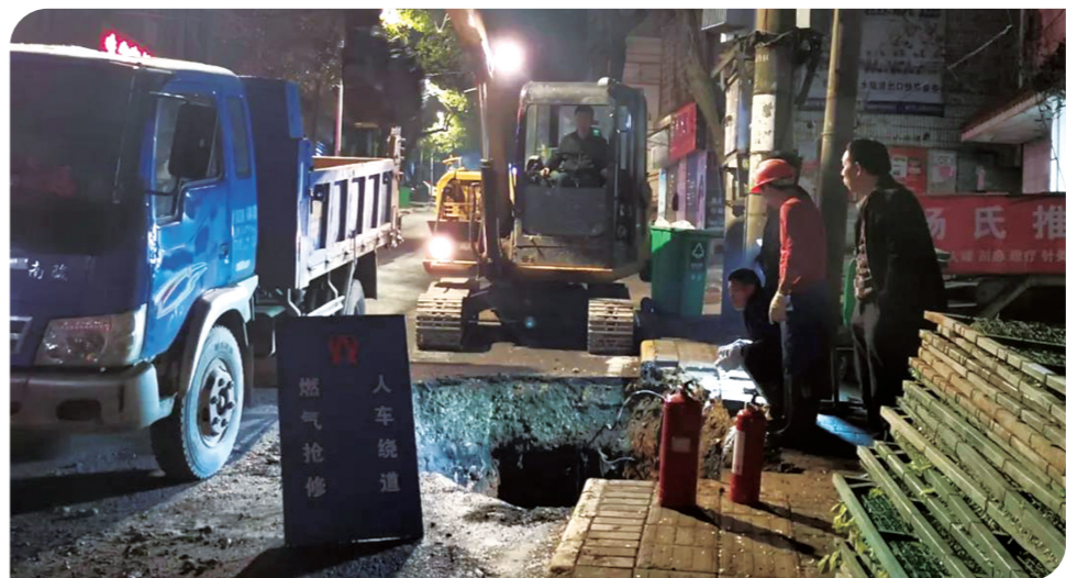
▲燃气泄漏处置现场