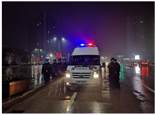
涪口区巡特警风雨无阻守护平安。