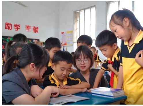
涪口区人民法院送法进校园。