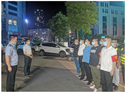
义务巡逻人人参与,平安涪口人人共享。

编者按: 号角已经吹响,奋斗正当其时。踏上新的征程,涪口区政法各单位紧盯市第十三次党代会和区第二次党代会确定的各项目标任务,勇于担当,善于作为,按照标准抓落实。积极践行五字要求,持续在“快、实、高、新、效”上发力,努力提升专业能力、群众工作能力、解决问题能力,以“争当表率、争做示范、走在前列”为要求,肩负起“培育制造名城、建设幸福株洲”和打造“青春涪口、创业新城”的职责与使命。