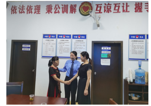
小小司法所,调解大作为。