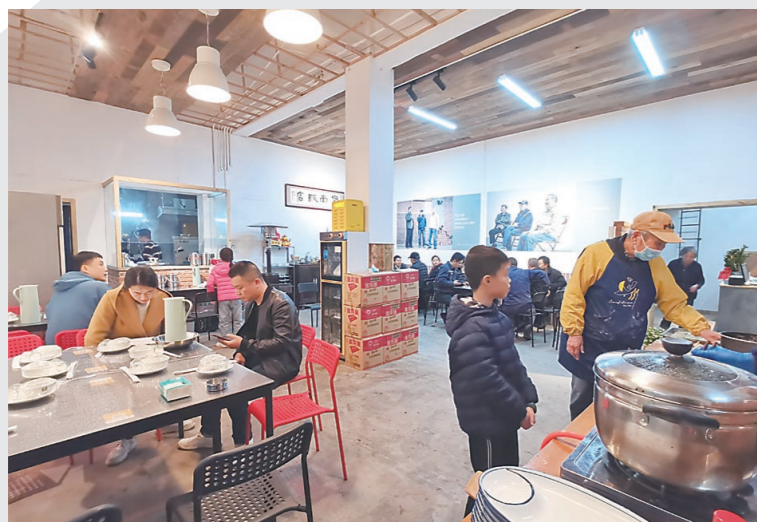
▲爷爷们做饺子时,小朋友在一旁认真观看。

在工厂干了大半辈子,无所作为的养老不是他们心甘情愿的结局。开个饭店,逐梦房车旅游,3位“宝藏爷爷”决心用年轻时工作中打破常规的心态,来开创尚余的人生。