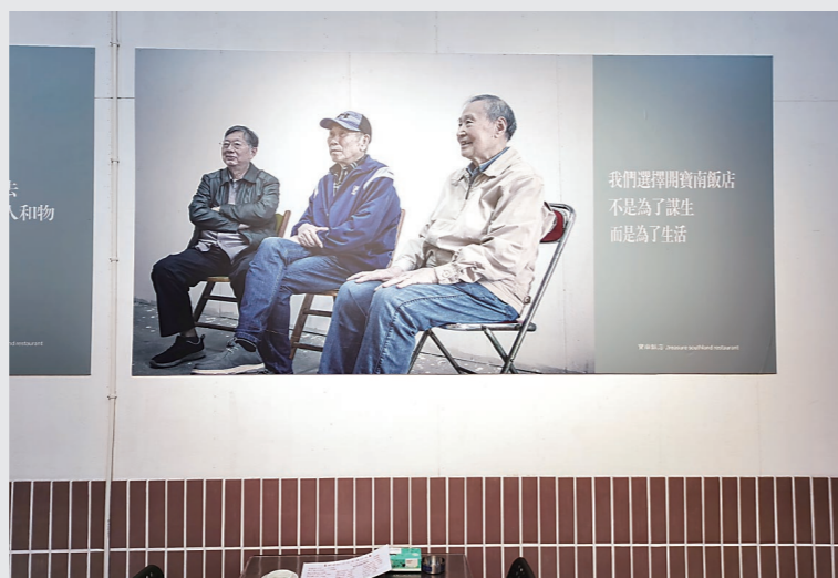
▲墙上3位爷爷的照片旁写着这样一句话:我们选择开宝南饭店,不是为了谋生,而是为了生活。