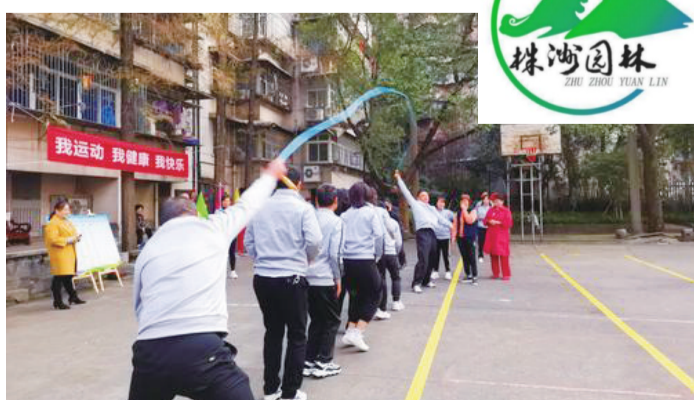
运动员们跳长绳的精彩瞬间。株洲日报·掌上株洲通讯员/李向红 供图

据悉,自10月份启动的“随手拍”摄影大赛累计收到参赛作品170余幅,评委组认真评审后,最终评选出10幅获奖作品。这些作品用镜头记录和展