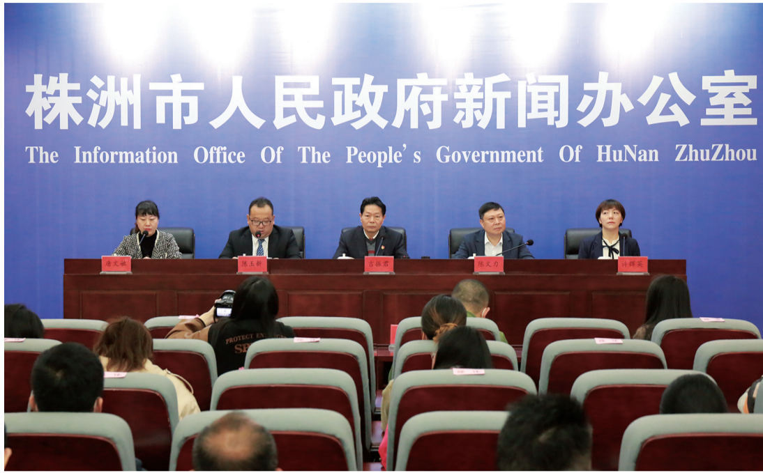
新闻发布会现场。