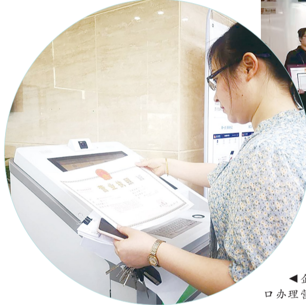
企业工作人员到“一窗通办”窗口办理营业执照。

截至10月底,全市各级市场监管部门已启动388项部门内“双随机、一公开”检查,129项部门联合抽查,共抽取检查对象6719户,检查结果均及时通过国家企业信用信息公示系统(湖南)对外公示。以监管方式创新提升事中事后监管效能,实现对违法者“利剑高悬”,对守法者“无事不扰”。