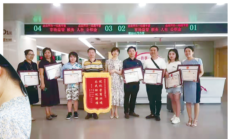
企业给市市场监管局送感谢锦旗。