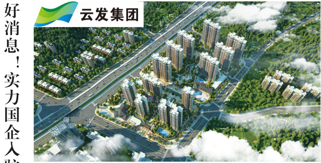
藏龙湾项目效果图。

株洲日报·掌上株洲讯(记者/文楼 通讯员/许谦) 近日,株洲市云发发展投资控股集团置业有限公司与上海君和置业有限公司(以下简称“上海君和”)就合作开发藏龙湾项目进行签约仪式。