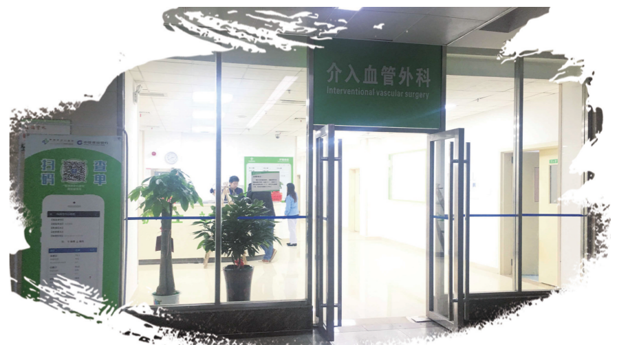
▲介入血管外科住院病房