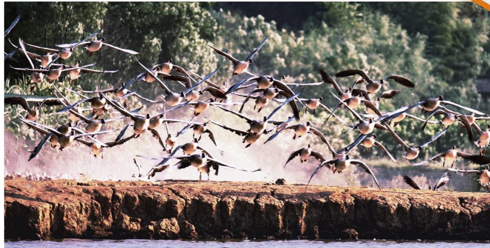
▲响水村鸿雁齐飞。

近一个月来,季秋未曾离去,孟冬不敢到来。那天天悬挂于蓝天之上的太阳,好像已经不记得了雨天的存在,时时把湖湘大地照射得温暖如春,这就让我不由自主地想起了盛传于湖南的一句俗语:“二四八月乱穿衣”。是呀!湖南的春、夏、秋、冬季,让人傻傻分不清。庚子年的这个秋冬交换季,虽然已近立冬之日,但是阳光依然灿烂无比,穿透飘窗上的玻璃,尽情地倾泻在妻子铺于窗台上的灰色棕棉垫上。午后躺于其上,一阵阵暖流穿过脊背,涌入胸膛。偶尔抬头相望于对面楼栋与我平行的楼层飘窗,则能看见两个小朋友手捧书本,亦在暖暖地晒着太阳。哦!暖阳、时光、阅读,此时此刻都如金色岁月一般流淌。斜望窗外渐渐西沉的太阳以及楼下呼啸而过的车辆,我蓦地想起响水村秋季惹人陶醉的风光。