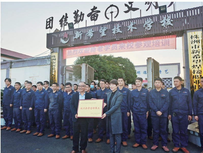
▲市人社局将“株洲新希望铆焊工”特色劳务品牌授予株洲市新希望职业技术学校。

据悉,被认定为株洲市特色劳务品牌可获得相应补贴,人社部门会对建设单位及特色职业培训协同项目进行重点培育,并从中挑选一批申报省级特色劳务品牌。当然,获得这块招牌的企业并非一劳永逸,他们需要在劳动者技能培训、乡村振兴等领域发挥引领作用,帮助更多的劳动者创业就业。从明年开始,人社部门将对各个特色劳务品牌进行复核,达不到条件的将责令限期整改,连续两年复核不合格将取消其资格并收回牌匾。