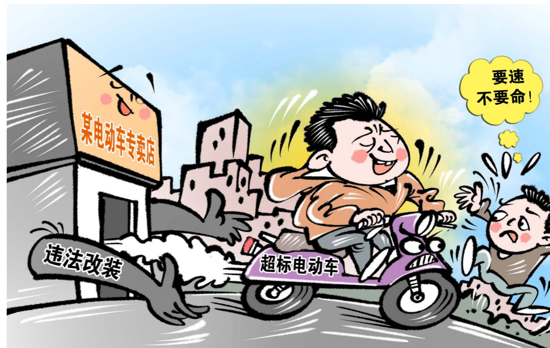
▲“黑手”助推。新华社/商海春 作