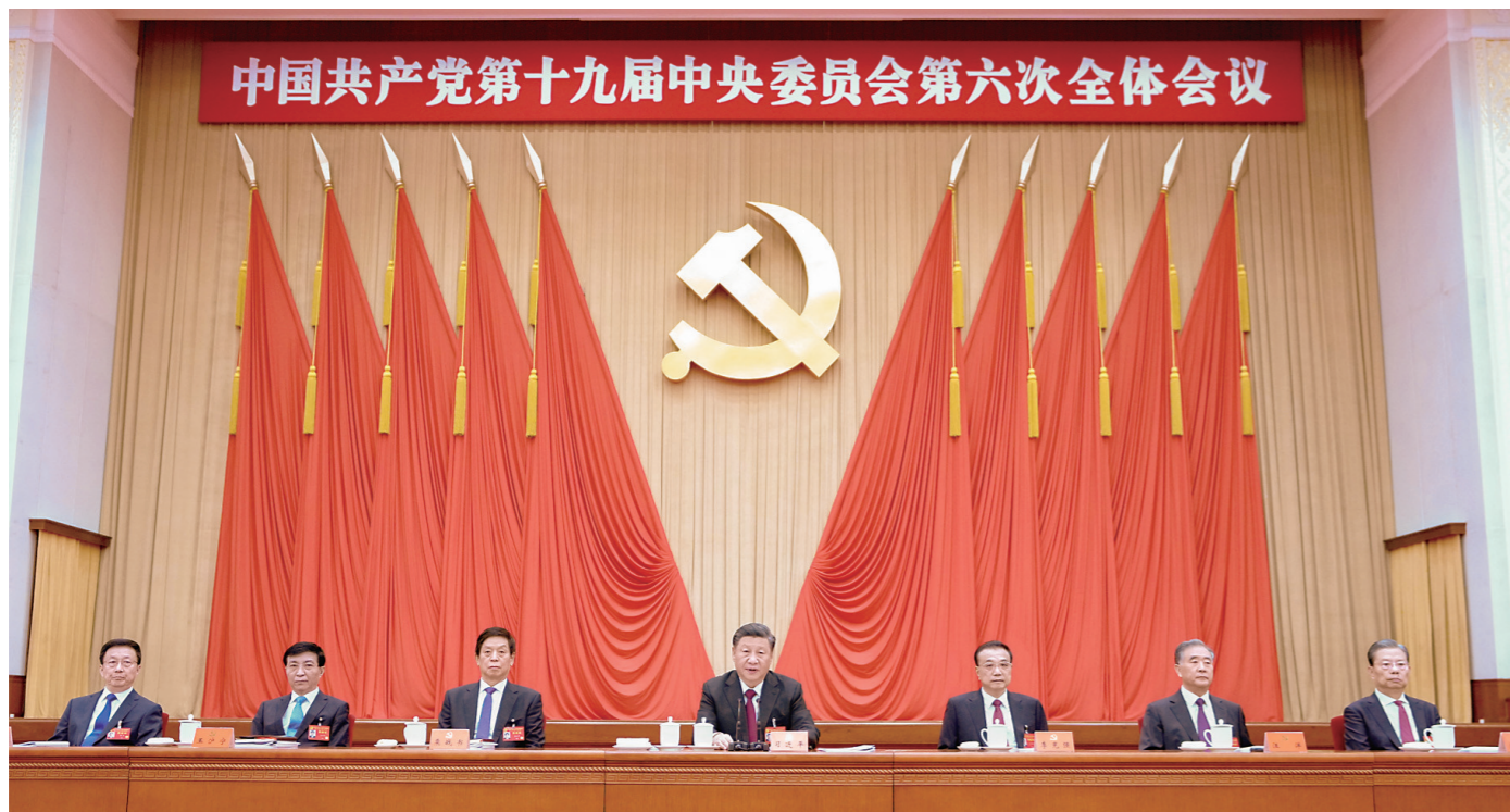
▲中国共产党第十九届中央委员会第六次全体会议,于2021年11月8日至11日在北京举行。这是习近平、李克强、栗战书、汪洋、王沪宁、赵乐际、韩正等在主席台上。

全会听取和讨论了习近平受中央政治局委托作的工作报告 全会审议通过了《中共中央关于党的百年奋斗重大成就和历史经验的决议》和《关于召开党的第二十次全国代表大会的决议》