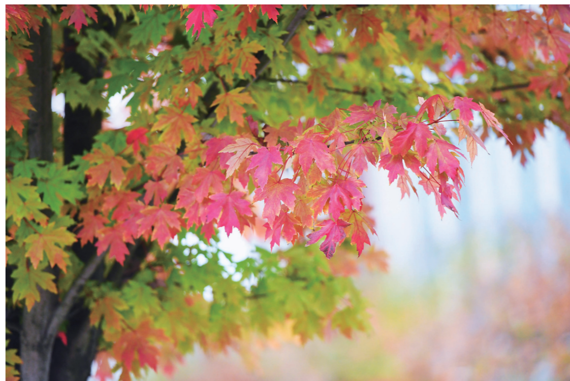
▲近日,神农大道,红色的枫叶正绽放出迷人的魅力。