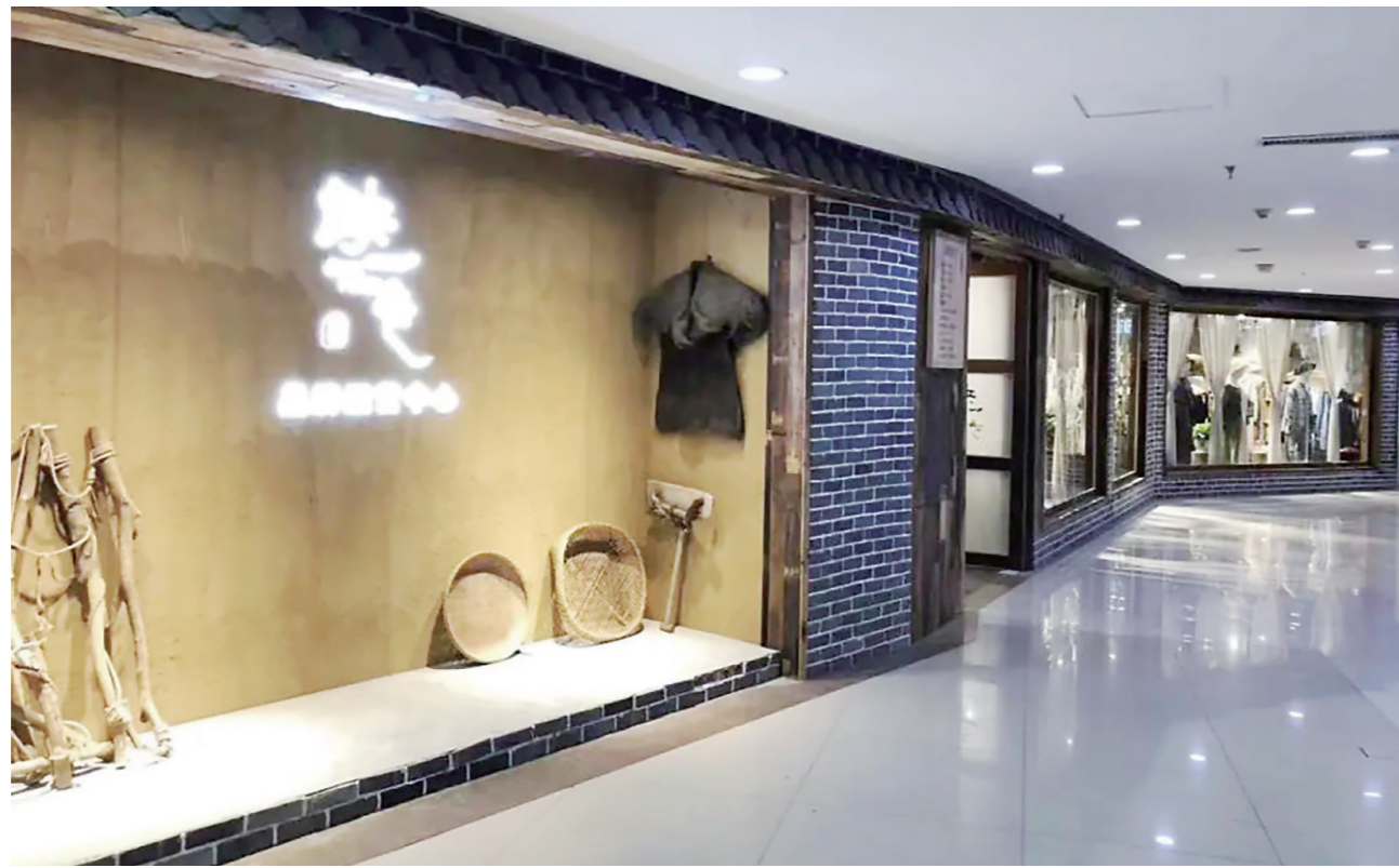
▲新华丽市场六楼的“缺一色”服饰店。