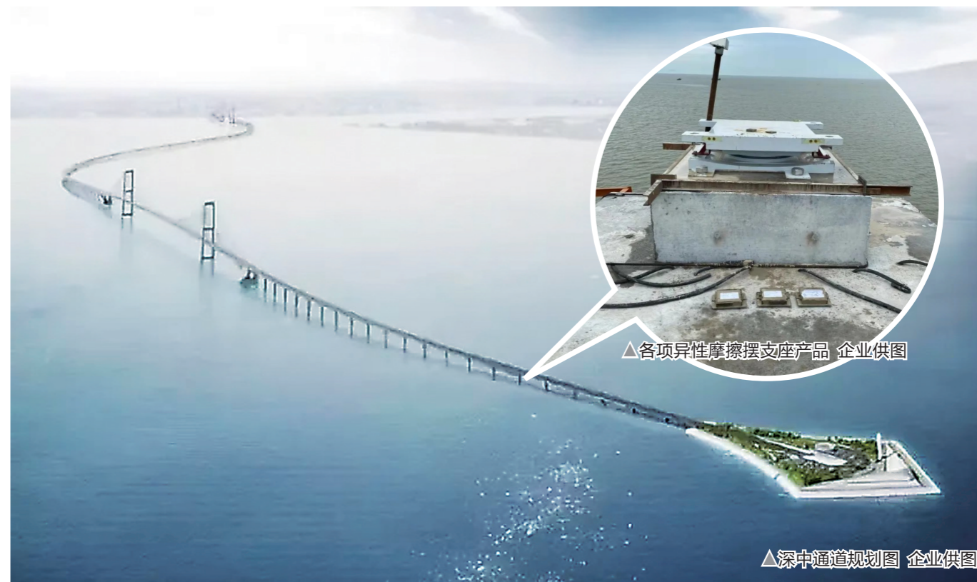
近日,株洲时代新材制造的各项异性摩擦摆支座,成功安装于国家超级工程——深中通道(又称“深中大桥”)。此支座能延长桥梁结构纵、横振动周期,耗散地震能量,抗击地震、台风等自然灾害。深中通道通车后,由深圳到中山只需30分钟可直达。