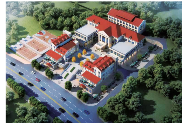
▲青龙湾社区医院效果图

人生进阶,当有一墅!土地资源日趋紧缺,“限墅令”的不断升级,使得墅类资源愈加稀缺难得。但你相信吗?如今花70万元,可以买一栋四层超级别墅,实现全家人梦寐以求的别墅生活梦想! 在青龙湾,这绝不是一句玩笑话。