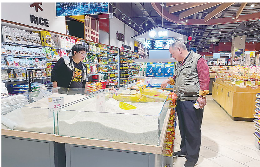
▲市场上供应充足,市民正在选购商品。

记者当天在株洲百天超市、步步高、天虹等商超看到,蔬菜、粮、油、肉等生活物资供应充足、品种丰富。现场不少市民正在推车选购。